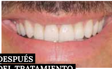
DESPUÉS DEL TRATAMIENTO

Cada día son más los pacientes que presentan desgastes dentarios acusados, que pueden estar causados por ácidos (que ingerimos con la dieta o se generan por problemas gástricos), por sustancias presentes en el ámbito laboral (plantas químicas, siderurgia, soldadores, etc.) o bien por bruxismo (apretamiento dentario). Para resolverlo, lo ideal es recurrir a un tratamiento no invasivo, es decir, sin necesidad de realizar endodoncias o tallar los dientes con esmalte sano para colocar coronas, que podría debilitarlos aún más.