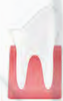
Pieza dental dañada